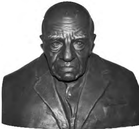
تندیس استاد احمد بیرشک

ساختمان سرای چهره‌های ماندگار از دو سوی شمال و غرب به ایوانهای ستوندار منتهی می‌شود و معماری بنا از نوع دوران تجدد است. عمارت سرای چهره‌ها و عمارت جنوبی آن پس از تملک رضا شاه به عنوان کاخ اختصاصی به ملکه توران ملک‌شاهی، همسر دوم رضاخان و مادر عبدالرضا پهلوی، اختصاص یافت. عمارت بیرونی، محل سکونت ملکه بوده است و در عمارت اندرونی نیز خدمه ایشان مستقر بودند. بعدها تا قبل از پیروزی انقلاب کاخها در اختیار نظامیان نزدیک محمدرضا پهلوی که در سعدآباد مستقر بودند، قرار گرفت. مصالح به کار رفته در بنا ترکیبی از خشت و آجر است و پوشش بام، با حلب یا ورق شیروانی عایق شده است. این شکل از پوشش، معرف کاملی از بناهای بیلاق اعیان تهران در شمیران که آب و هوای سردسیری و کوهستانی دارد بوده است. هم‌اینک مرمت و حفظ این بنا از سوی سازمان میراث فرهنگی، صنایع دستی و گردشگری با حفظ اصالت بنا به اتمام رسیده است.